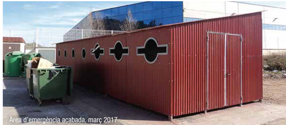
Àrea d'emergència acabada, març 2017

resum de peticions que s'han fet a les subvencions de la Diputació per diverses accions, així com que es publicarà ja el Pla Parcial per ampliar el sector Terradelles, atès que ja s'ha constituït l'aval per les obres d'urbanització.