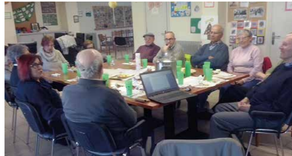
Caldo de Carnaval, febrer 2017

pugueu tenir com a veïns i veïnes del poble que sou. Ens podeu venir a veure en aquests horaris o trucar al 652798946 o enviar un correu a olist@fado.chv.cat i resoldrem qualsevol dubte que pugui sorgir sobre tot el que hi fem o hi podríem fer com a servei de proximitat que volem ser en tot moment. Treballant en tot moment i de forma estreta amb el casal d'avis volem, cada vegada més, que els grans d'Olost tinguin l'oferta i les activitats que es mereixen! Com a mostra, a l'agenda de la pag. 4 us avancem una proposta. Ens hi veiem!!!