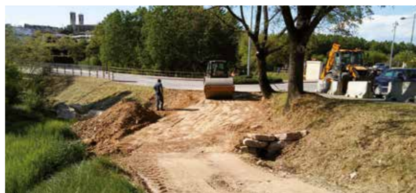
Nou accés al camí de Campa

I per últim destacar el mur de contenció que s'ha fet al Carrer de la Font, degut a una esllavissada produïda pels últims aiguats al talús de les escales del mateix carrer, que impediè el seu normal accés. Aquest mur s'ha construït amb rocalla de grans dimensions, garantint definitivament la seva estabilitat. Un cop acabada l'obra i en una altra fase, s'haurà de reconstruir l'escala per accedir a la font. El seu cost és de 4.500€.