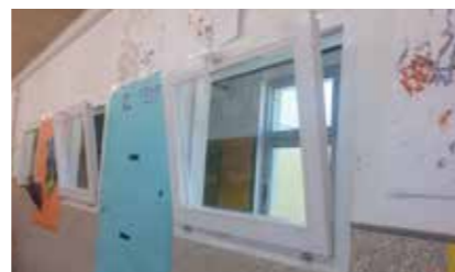
Finestres Escola bressol