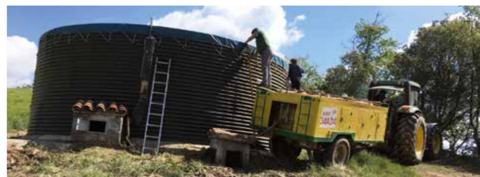
Treball voluntaris d'Olost al dipòsit de Garduixeres. Abril 2017

voltant del dipòsit i van netejar-lo per dins. A més a més es va comprovar l'estat de la Cuba, les seves mànegues i les llances. L'únic cost d'aquesta actuació varen ser els 36 euros que val la goma nova i que han anat a càrrec de l'ajuntament.