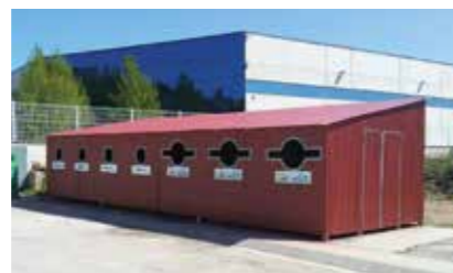
Àrea d'emergència renovada