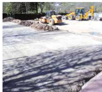
Preparació del terreny per les pistes de pàdel

I, en cinquè lloc , perquè va ser un dels projectes votats al procés de participació i perquè es va aconseguir la subvenció, s'han començat les obres al local de sota l'ajuntament, l'antiga Caixa Manlleu, per a adequar-la com a sala d'exposicions, presentacions i xerrades. Canvi de sostre, de llums i de panells de parets, així com mobiliari nou, donant com a resultat una sala mitja i adequada per a tot tipus de celebracions.