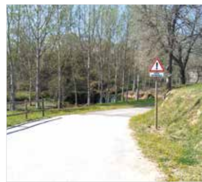
Senyal de zona inundable