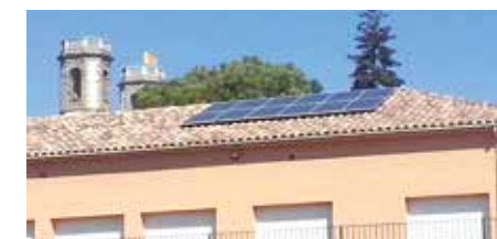
Instal·lació fotovoltaica al Centre Cívic

Seguint aquest camí cap a la millora energètica i la sostenibilitat ambiental l'Ajuntament d'Olost té previstes noves accions per l'any 2017 com la instal·lació d'una caldera de biomassa que doni calefacció al centre cívic i al casal d'avis, a través d'un projecte amb la Diputació de Barcelona, ampliar les instal·lacions de LED en l'enllumenat municipal, instal·lació fotovoltaica d'autoconsum per l'edifici de l'ajuntament i estudiar la possibilitat d'instal·lar un punt de recàrrega per a vehicles elèctrics, pel qual ja s'han iniciat els tràmits per demanar una subvenció.