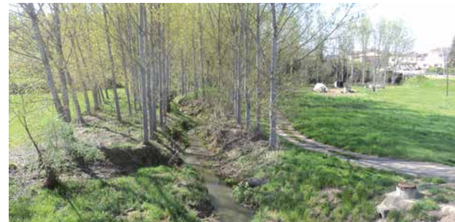
El medi ambient. Un patrimoni a conservar.

Durant l'any 2016, l'Ajuntament d'Olost ha tingut un consum energètic de 592.000 kWh (entre electricitat i calefaccions) en totes les seves dependències i enllumenats públics. Aquest consum suposa un nou estalvi del 13% en comparació al consum del 2015. A nivell de cost, la despesa energètica del municipi ha estat de 66.000€ (estalvi de l'11%).