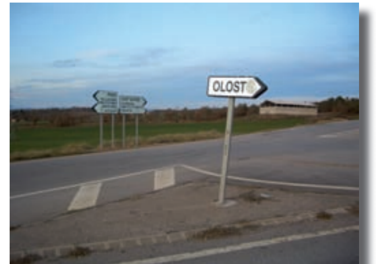
Encreuament amb Perafita

ve de Perafita. D'altra banda, el nou traçat dóna prioritat (al contrari del que passa ara) al trajecte Olost-Prats en lloc del de Perafita-Prats. Es construeix un viaducte de 165 metres sobre la riera Gavarresa i la passarel·la peatonal de Santa Creu queda substituïda per una altra de nova construcció. Així, el projecte pretén millorar la visibilitat en la intersecció amb la carretera a Sant Martí d'Albars. La resta del recorregut fins a Olvan segueix la traça actual, però amb millors encreuaments, tercers carrils, limitació de pendents màxims, ampliació de ponts i eliminació de grans revolts amb viaductes sobre les rieres del Lluçanès i del Portarró. Tal com ho marca la normativa, disposarà d'un voral d'1 metre per cada costat i de dos carrils de 3,5 metres. La velocitat mitjana prevista a la qual es podrà circular és de 60 km/h. El temps d'execució de les obres està previst en 28 mesos, per tant, el juliol de 2011. Un cop finalitzada, un cotxe podrà fer el recorregut Olost-Olvan en aproximadament 16 minuts.