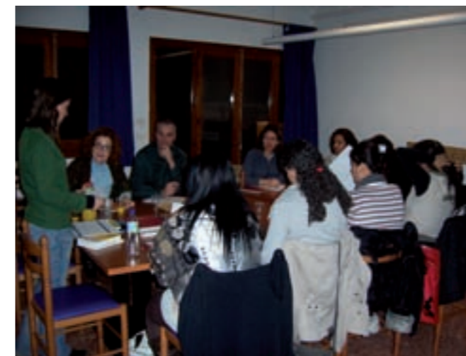
Curs català 2008-2009

Durant la tardor de 2008 es va obrir la inscripció per fer un curs de català inicial, organitzat pel Consorci de Municipis del Lluçanès i que es feia a Olost. L'alt nombre d'inscripcions va provocar que alguna persona es quedés fora del curs i, per tant, fa pensar que caldrà augmentar i diversificar encara més aquest tipus d'oferta. El curs va començar a finals d'any i s'allargarà fins el maig de 2009, amb un total de 30 hores i 12 inscrits. Les motivacions dels participants han estat diverses: des de disposar d'un millor nivell de català, fins a donar continuïtat a cursos fets anteriorment. Els participants també han expressat la necessitat de cercar parelles lingüístiques per poder agafar un major domini de la parla.