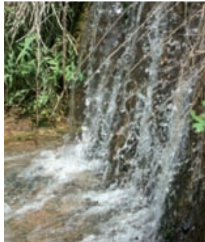
La Sequera, punt i final.

Aquest any ha representat, en part, el final d'un període de sequera important al nostre municipi i, en general, a tot Catalunya. Tot just aquest passat mes de gener s'ha donat per acabat el decret de sequera i les restriccions que comportava. Aquí teniu les dades més importants de l'any 2008: 909 l/m2 de pluja, que representa el 3r any més plujós des que en Pere Bruch pren dades (1986) i molt superior a la mitjana, que és de 690 l/m2. Això encara és més significatiu si tenim en compte que l'any 2007 la precipitació va ser de 382 l/m2. Això ens fa tenir esperança en el futur, sense oblidar, però, que la gestió i el consum de l'aigua depenen de tots. Que no pari!