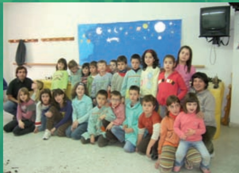
Tallers de Nadal 2008

• 15/02/09 a les 17h: CP LLUÇANES - CH ARENYS DE MAR.