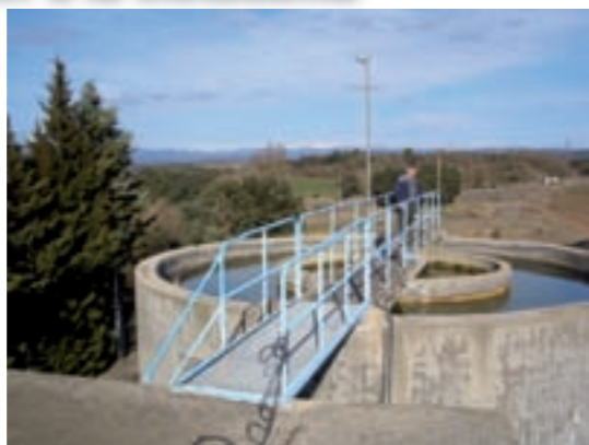
Feines de manteniment a la depuradora