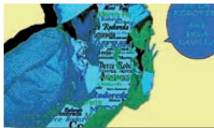
Cartell Contes Rodoreda

Amb motiu del centenari del naixement de Mercè Rodoreda (1908-2008), considerada una de les escriptores més importants de la narrativa catalana contemporània i reconeguda internacionalment, el bibliobús Tagamanent i l'Ajuntament d'Olost organitzen l'espectacle per a adults Contes de la Rodoreda . L'espectacle es farà el divendres 19 de desembre, a l'auditori de l'escola Terra Nostra. Hi esteu tots convidats.