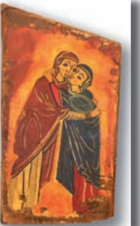
La Visitació de Sta. Maria de Lluçà

Des de fa 14 anys, pels volts de Nadal, el Grup d'Actors del Lluçanès escenifica la lectura d'aquest poema. Aquest any, l'actuació serà el dissabte 20 de desembre a les 10 de la nit a l'església de Sant Maria de Lluçà. El Grup d'Actors del Lluçanès estarà acompanyat, com cada any, per la Coral Nadalena, una coral integrada per persones del Lluçanès i del Berguedà que canta exclusivament per a aquesta ocasió.