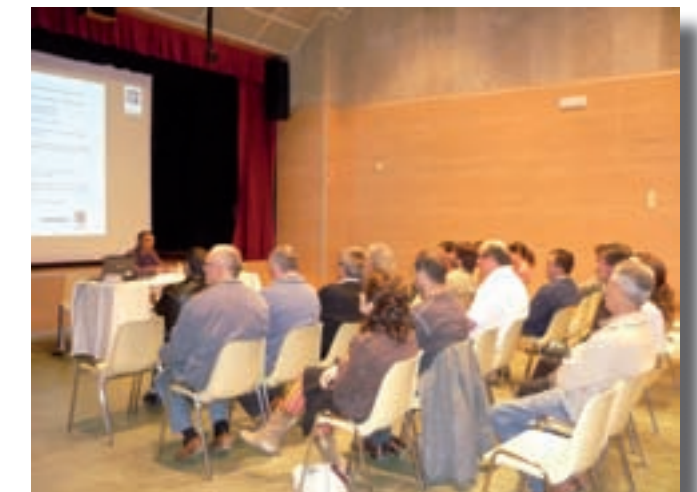
1a Edició jornades tècniques. Fira de l'Hostal del Vilar.

Aquest servei es posa a disposició dels interessats els dijous de 9h a 17h a la seu del Consorci i es durà a terme a través de l'empresa GQS i a càrrec de les veterinàries Joana Sureda i Rita Casals. Per sol·licitar més informació, cal posar-se en contacte amb el Consorci del Lluçanès (93 888 00 50).