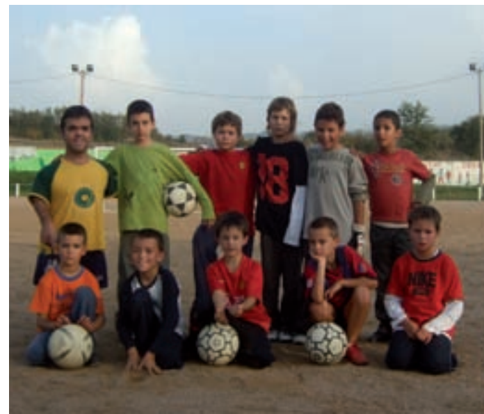
Benjamins del F. C. Olost, temporada 2008-2009.