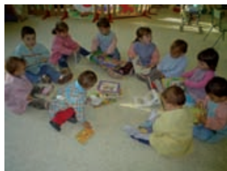
Llar infants Estel. Curs 2008-2009.

Cada dia un conte és la maleta de contes que viatja cada setmana des de la Llar d'infants fins a les cases dels nens i nenes. Els contes que conté són destinats als nens de 0 a 3 anys. La maleta viatgera, tal com s'anomena, funciona gràcies a la cooperació entre el Bibliobús i la Biblioteca d'Olost, que s'ocupen de buscar el material i portar-lo a la Llar d'infants, que té cura que tots els nens i nenes la rebien. La finalitat d'aquesta iniciativa és fomentar el gust per la lectura des de la infància, i també que pares i mares puguin compartir sensacions, emocions i valors amb el seus fills a través dels llibres. Aquesta activitat, que fa mes de dos anys que es realitza, ha estat ben acollida pels pares i les mares, que veuen l'arribada de la maleta a la Llar d'infants com un esdeveniment especial en la vida dels seus fills.