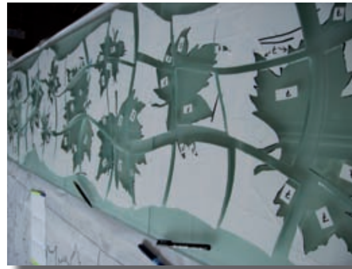
Instantània del mural en un moment de la seva construcció

L'elaboració del mural ha estat llarga i laboriosa. Està format per 69 peces de vidre, trencades i treballades individualment. A cada peça, s'hi va gravar la silueta de la fulla i el fruit del plataner amb raig de sorra. Les peces van ser pintades a mà amb pintures vitrofusibles cuites al forn a 565°C. Finalment, es van muntar les peces sobre vidre com si es tractés d'un trencaclosques. El mural Plataners Absents fou presentat el passat estiu a la convocatòria "Festa de les Arts".