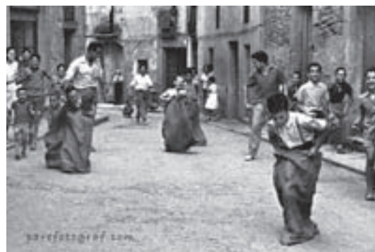
Cursa de sacs

És per tot això, i per moltes més coses, que volem endegar aquest nou projecte. A tots aquells que hi vulgueu participar, us convoquem al casal el dissabte 15 de novembre a dos quarts de 7 de la tarda. Parlarem del funcionament del projecte, mostrarem ja part del material que ja hem recollit i menjarem una mica. Us hi animeu?