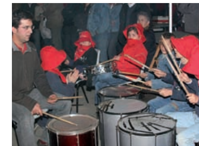
14a Edició de la Fira d'Olost, l'any 2007.