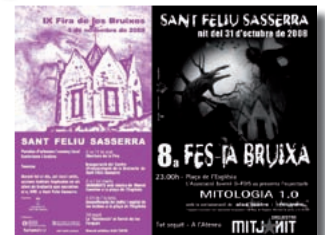
Programa IX Fira de les Bruixes

El projecte del Centre d'interpretació ha estat elaborat per l'empresa de produccions culturals Transversal. En el seu recorregut proposa una primera part (espai 1) on es dona una visió antropològica de la bruixeria ressaltant els principals costums i creences que caracteritzen la bruixeria. La segona part (espai 2) està muntada de forma més impactant, basada en recursos multimèdia. Aquesta part recrea els aspectes més foscos i tèrbols de la bruixeria (els processos, les totes...,) però també els més suggerents, que tenien lloc a la nit (les reunions de bruixes: el sàbat, els rituals...). Al final, es proposa una reflexió final sobre què ha significat el fenomen de la bruixeria a Catalunya.