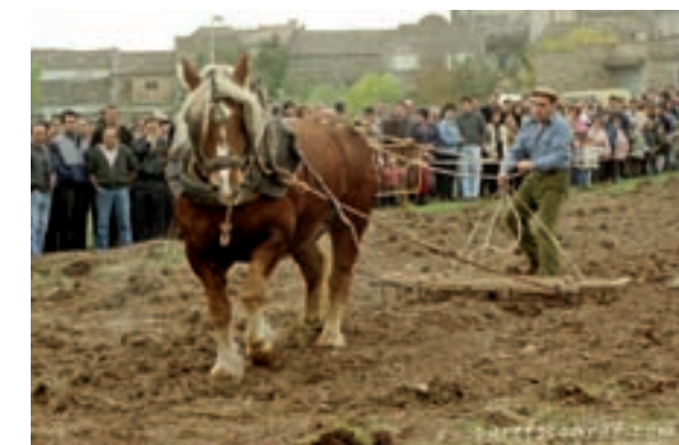
1a Edició de la Fira d'Olost, l'any 1994.

El proper cap de setmana, els dies 1 i 2 de novembre, tornem a celebrar la nostra fira. I ja per quinzena vegada. Des dels primers anys, la Fira ha quedat lligada al món de les arts i els oficis tradicionals, i sempre ha tingut una molt bona acollida per part dels veïns d'Olost i de molta gent de fora, que aprofita aquest motiu per conèixer una mica més de prop el nostre municipi.