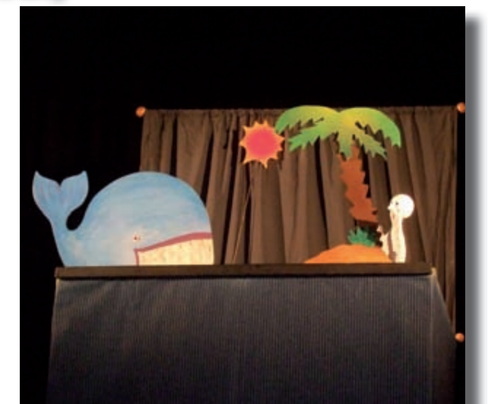
Espectacle Infantil a La Torre 2008