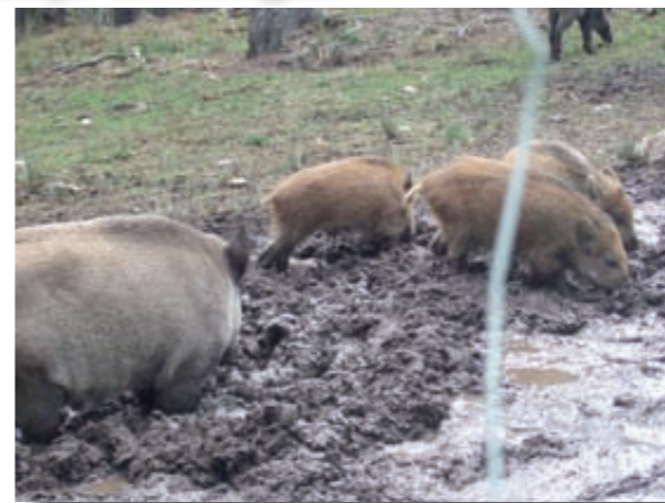
Senglars al parc de les Angles

La colla senglaire d'Olost, que sovinteja la caça del senglar als boscos del territori, organitza batudes els dijous, dissabtes, diumenges i dies festius durant el període legal de caça, en els llocs on han rebut queixes o demandes dels pagesos afectats pels danys que els senglars ocasionen als seus camps, o també allà on saben que n'hi ha. Cacen els porcs mascles i les femelles, però eviten caçar els garrins. Les batudes estan marcades amb cartells de batuda (qüestió d'interès per tot aquell que transiti pel bosc) i els caçadors estan obligats a portar armilles refractàries. Els caçadors s'ajuden amb gossos que segueixen el rastre i els porten on son els porcs. Quan s'ha acabat la cacera, els caçadors estan obligats a presentar un recompte dels senglars morts al departament de Medi Ambient i Habitatge, segons el Pla Tècnic de Gestió Cinegètica.