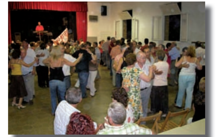
Ball a Ca l'Antonia

L'onze d'octubre començarà la nova temporada de balls de saló que la Tertúlia organitza des de fa anys a la sala de Ca l'Antònia d'Oristà. Als balls, hi assisteixen normalment gent gran, i la concurrència és nombrosa i participativa. El ball es fa el segon dissabte de cada mes fins al sopar de cap d'any. Durant el 2009, es faran el tercer dissabte de cada mes fins el 27 de juny, que serà l'últim. La Tertúlia és una associació cultural sense ànim de lucre que organitza els balls per divertir-se i passar-s'ho bé. Per assistir als balls, us podeu fer socis i pagar una quota anual, o bé abonar l'entrada de cada sessió.