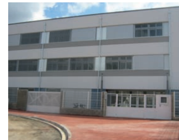
CEIP Terra Nostra