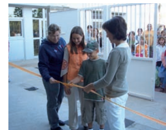
Ter dia al nou CEIP Terra Nostra

Som al curs 2008-2009 i Olost ja disposa del nou edifici de l'escola. Actualment, s'està acabant una primera fase que facilitarà els accessos als diferents espais del centre. Cal pensar que estem parlant de grans projectes en els quals s'està avançant i que significaran una reordenació de la zona esportiva i educativa, amb unes condicions òptimes d'accessibilitat i de comoditat per a tots els ciutadans que n'hagin de fer ús. Els agraïments són per a tothom: al col·lectiu de pares i mares per la seva col·laboració en el trasllat; a l'Ajuntament d'Olost, que ha fet un seguiment de molt a prop del projecte perquè en cap moment hi faltés res; i, sens dubte, a l'equip de mestres –els grans protagonistes–, que amb la seva dedicació i el seu esforç al llarg de l'estiu van fer possible que el passat 15 de setembre s'iniciés el curs amb la normalitat necessària. I tot això s'ha fet en un edifici amb un entorn privilegiat i que, a diferència de l'escola vella, disposa d'un gimnàs-teatre, un menjador gros amb cuina equipada, una aula de psicomotricitat, un despatx per a l'AMPÀ, una àmplia biblioteca, tutories i despatxos per atendre les famílies i una consergeria. La inauguració oficial tindrà lloc el proper dimecres 19 d'octubre, amb la presència del conseller d'Educació de la Generalitat, el Sr. Ernest Maragall. Hi esteu tots convidats!