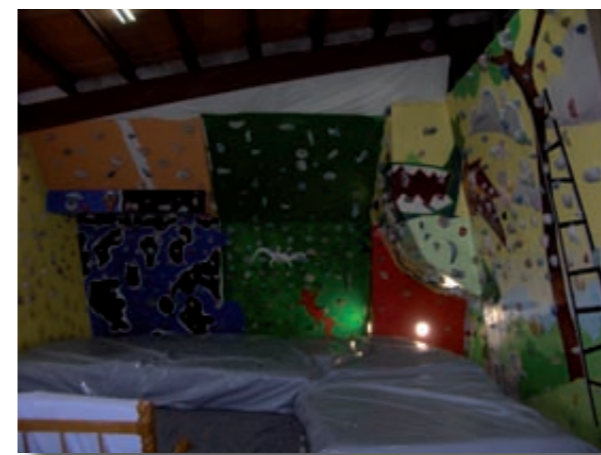
Búlder Cal Ferrer

Hem obert les portes del búlder en diverses ocasions: l'octubre del 2007 es va realitzar a Cal Ferrer un curs d'iniciació a l'escalada (obert a tothom) que va durar fins al març de 2008. El 8 de juliol del 2007 es va celebrar la "1a trobada al búlder cal ferrer" i el 19 d'abril del 2008 es va celebrar el 1r aniversari. També disposem d'un blog a internet ( calferrer.blogspot.com ), en el qual es poden consultar notícies del món de l'escalada, activitats diverses que la gent del Centre excursionista Via Fora realitza i també s'hi poden fer suggeriments.