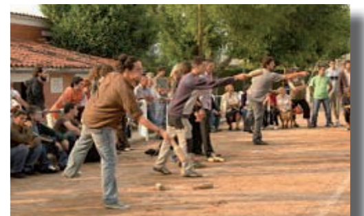
Bitlles Olost 2007

És el segon any que se celebra aquest campionat a diversos pobles del Lluçanès. A cada poble, s'hi celebra un torneig, amb equips de com a mínim 5 persones. El calendari de competició és el següent (tots comencen a les 18h): 13 de juliol a Sta. Eulàlia de Puig-oriol; 20 de juliol a Perafita; 27 de juliol a Prats de Lluçanès; 3 d'agost a Alpens; 23 d'agost a Olost; i 7 de setembre a la Torre d'Oristà. La coordinació de les inscripcions va a càrrec del Punt Inquiet: telefon 93 888 04 12, pàgina web joventut.consorci@llucanes.cat .