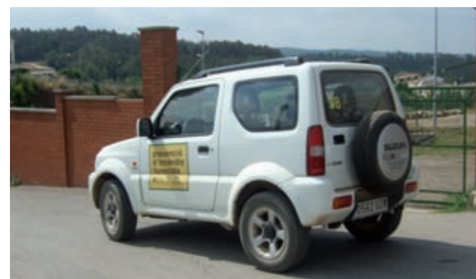
Unitat mòbil 98

Les unitats mòbils formen part del Pla d'Informació i Vigilància Complementària contra incendis forestals (PVI), que s'activa durant els mesos d'estiu com a reforç als ADF (agents rurals) i altres dispositius que cobreixen la vigilància dels boscos durant l'any. El Pla d'Informació i Vigilància, que s'estructura per zones i rutes, és gestionat i planificat coordinadament pels ADF, els ajuntaments i la Diputació de Barcelona. Olost pertany a la zona d'Osona i el centre de comunicacions és Control Osona, que es troba al Parc de Bombers de Vic.