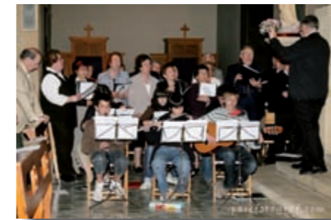
Coral noves veus