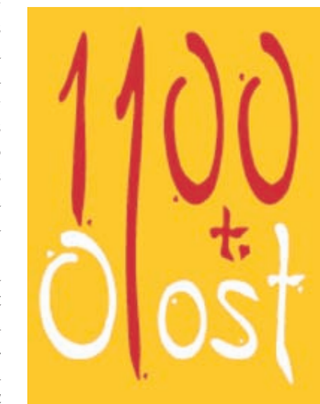
Disseny: Jordi Palau