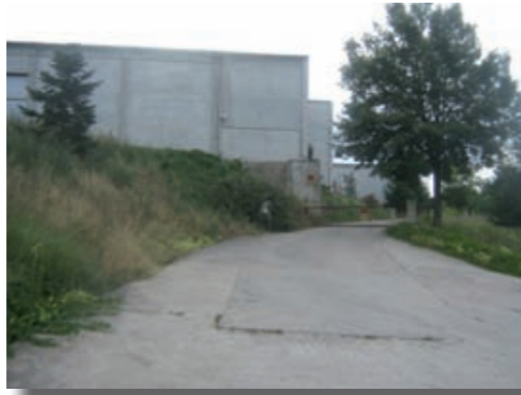
Futura ubicació de Casa Tarradellas

L'empresa Casa Tarradellas ha adquirit l'antiga fàbrica tèxtil Turbofil. Es tracta de naus de 12.000 m2, que es convertiran en un nou centre de producció de l'empresa. Està previst que aquesta planta es dediqui a la producció d'elaborats carnis i plats refrigerats i que suposi la creació de 50 a 100 nous llocs de treball, als quals podran optar preferentment els veïns d'Olost i l'àrea d'influència geogràfica.