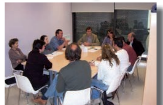
Reunió inaugural abril 2008

El dilluns 28 d'abril, en una acte celebrat al Consorci, es va constituir l'associació de Propietaris Forestals del Lluçanès. Hi van assistir propietaris forestals que es van voler implicar a fons amb aquesta nova Associació. La seva finalitat és el foment, protecció i conservació dels boscos del Lluçanès, l'elaboració i desenvolupament dels plans de recuperació i valorització de les finques forestals dels associats; la realització d'estudis, seminaris i cursos relacionats amb la problemàtica dels boscos, així com la col·laboració amb els serveis d'extinció d'incendis.