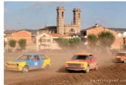
Tarda de motor

La Tarda de motor és un dels actes de la Festa Major que més participants i públic aplega. Els organitzadors, Amics del motor d'Olost, es reuneixen durant tot l'any en els camps circumdants a la Balma del Gitano per provar els cotxes i córrer en un circuit que ells mateixos han dissenyat. Des de fa més de sis anys, organitzen per la Festa Major organitzen la Tarda de motor, una exhibició lúdica i esportiva de vehicles, per passar-s'ho bé i transmetre a les generacions futures la passió que senten pel tot allò que té rodes i espètega. En l'exhibició, hi participen motos, quads, speed-cars i cotxes. Les proves es realitzen per categories de vehicles: comencen els més joves amb motos i quads de poca cilindrada, i acaben els cotxes, amb diverses proves de selecció i exhibició. El circuit, d'1 km de longitud i 800 m. d'amplada, està ubicat al camp de futbol vell i equipat amb zona de boxes i tanques protectores. Els organitzadors compten amb la col·laboració de l'Ajuntament i l'Associació dels Cremats.