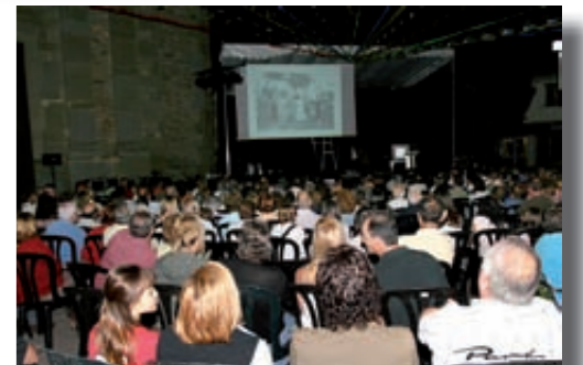
Agenda familiar 2008

Per a qualsevol altra consulta, us podeu adreçar als diversos ajuntaments o a la web http://consorci.llucanes.cat/