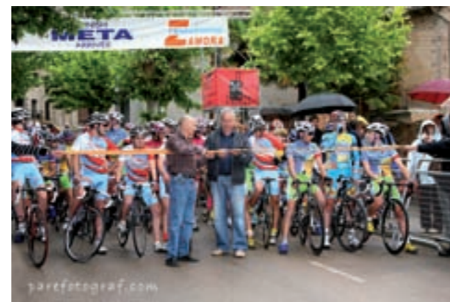
Sortida cursa 2008

Per acabar, volem donar les gràcies a tothom que amb la seva ajuda va fer possible que portéssim la cursa a bon terme. Moltes gràcies.