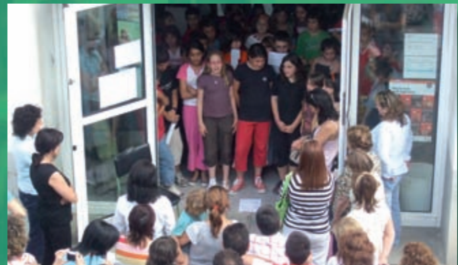
Última sortida del Carrer de les Escoles

- Solc d'Allà-enllà. A les 6 de la tarda, taller de danses de Castella i Lleó: brincaos, seguidillas, bailes corridos i ajechaos. A 2/4 de 11 de la nit, a la plaça, concert i ball amb Djanbutu Thiossane (Senegal) i Hexacorde i Vanesa Muela (Castella i Lleó).