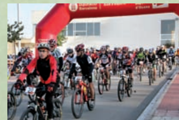
Sortida de la Pedalada del Rovelló.