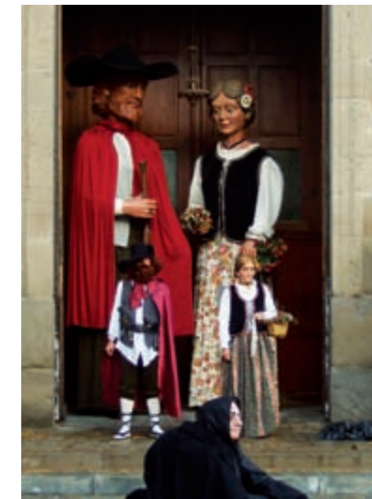
fira d'en Rocaguinarda 2011

18ena Fira d'en Rocaguinarda. Malgrat les condicions climatològiques, les pessimes prediccions del Meteocat de bon matí, la por a la pluja i la poca afluència de firaires la il·lusió i l'esforç d'un poble va fer possible que un any més s'escenifiqués amb força públic la llegenda d'en Rocaguinarda als carrers d'Olost. I és que com deia Peter Pan "Tot és possible si ho desitges amb força"