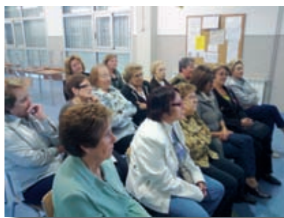
Lliçons de cuina. Octubre 2011.

A l'inici de la 7ª temporada del Programa Activa't! ens ha semblat convenient fer una mica de balanç dels projectes fets, així com de l'oferta actual. Anem a pams. A més a més de que, a Olost i Santa Creu de Juglar, estem fent grups de gimnàstica, amb unes 40 persones, i tallers de memòria, amb unes 20, ja portem 4 anys parlant de cuina, 3 anys amb projectes intergeneracionals amb l'escola, 5 anys amb grups, cursos i projectes de cara als cuidadors de persones en situació de dependència i 5 anys amb una bona oferta de cinema, entre altres projectes i xerrades puntuals que s'han anat succeint al llarg d'aquest temps gràcies, entre altres raons, a la voluntat de l'ajuntament per oferir aquest servei i al treball de complicitat que sempre ha existit entre l'Activa't! i el Casal dels Avis.