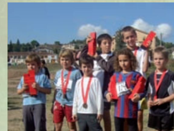
Alguns dels atletes d'Olost.

El projecte de restauració del vitrall de la façana de l'església ha despertat gran interès i participació. Per aquest motiu l'organització realitzarà un taller gratuït sobre vidre. Per altra banda, després de les dificultats de l'organització de trobar un local que reunís les condicions per poder realitzar la restauració sense gaires problemes d'espai, l'ajuntament ha cedit al grup una sala de l'escola vella. L'organització també ens informa que està oberta a tothom d'Olost que vulgui seguir de prop el tema.