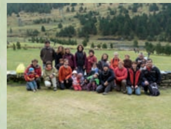
Vall de Núria. Octubre 2011.