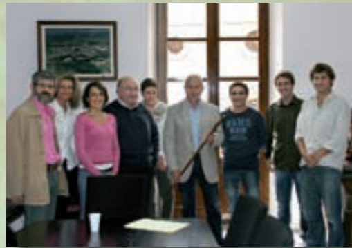
Regidors legislatura 2011-2015

Àrea de serveis i Atenció a les persones i que inclou Cultura, Joventut, Esports, Educació, Sanitat, Serveis Socials i Partici-