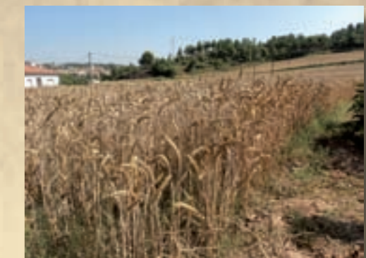
Camp de blat a Mas Lliscàs. Juliol 2011