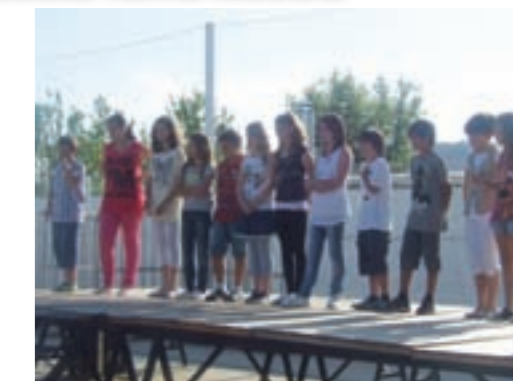
Sisè curs Escola T.N.

L'escola Terra Nostra va celebrar el final de curs el diumenge 19 de juny al pati de l'escola. La tarda va començar amb una visita a les aules on els alumnes hi tenien exposats els treballs de curs i seguidament es va gaudir d'un divertit espectacle de màgia i humor de la mà de Xicana, una pallassa molt tendra. La part més emotiva de l'acte fou protagonitzada pels de sisè. Mestres i alumnes es van acomiadar amb cançons i amb un fins aviat. És el primer any que la comunitat educativa organitza la festa de l'escola a les portes de l'estiu amb un sopar i un bonic acomiadament.