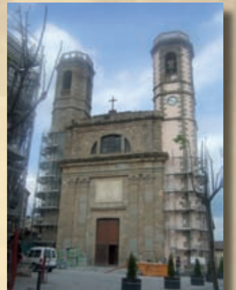
Santa Maria d'Olost Maig 2011