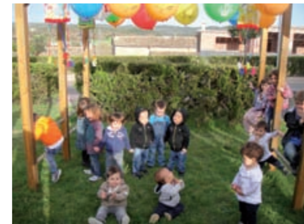
Festa primavera 2011

i pastissos que han preparat els pares i mares. Després juguem amb pinyates i globus fins a cansar-nos". La segona festa que preparem és la festa de Fi de Curs, a finals de juliol. És una festa d'adéus i de benvingudes, a reveure pels que deixen la llar per pujar a l'escola i de benvinguda pels que entren a la llar. "Els nens i nenes s'ho passen molt bé amb els inflables i amb un bon berenar. Des d'aquest espai que ens ofereix la Pedra de Toc animem a tots els pares i mares a formar part de l'AMPA perquè puguin participar i col·laborar de manera ben propera en l'educació dels nostres fills".