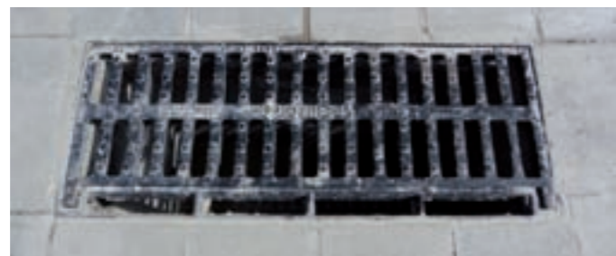
Nou clavegueram. Maig 2011