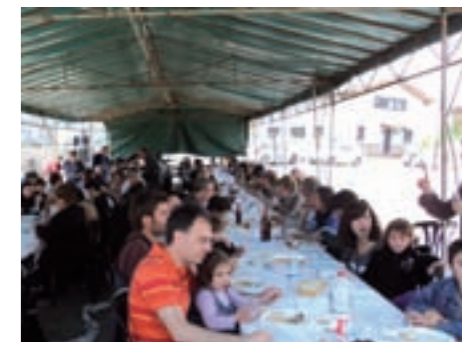
Fira de Santa Creu 2011

El diumenge, dia 1 de maig, Santa Creu de Jutglar va tornar a ser "capital del món". Entre les 8 i les 10 del matí, els seus veïns i veïnes van poder veure com anaven sent "ocupats" els seus carrers, per un exèrcit de més de 100 caminants famolencs que després van ajuntar-se amb uns quants centenars més i es van passejar tot el dia pel costat de casa seva. Parades, animals, talleristes, presentacions, exposicions i dinar, organitzats excel·lentment per la Comissió de festes de Santa Creu i el Consorci. Felicitats a tots ells! A la tarda, la festa va acabar amb una petita sessió de ball, organitzada pel SOLC.