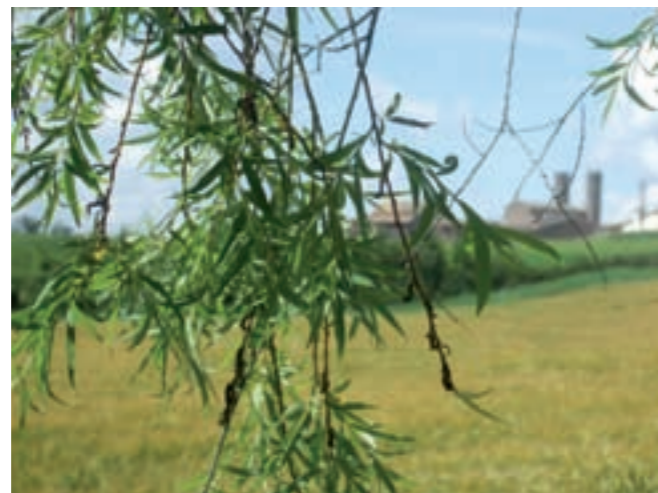
Olost. Municipals 2011.

Vull tornar a ser el vostre alcalde perquè hem fet molta feina, i especialment, per la feina que queda per fer i que la podem fer perquè tenim un ajuntament sanejat econòmicament, perquè mai estirem més el braç que la màniga. Vull ser l'alcalde perquè complim amb els nostres compromisos. Perquè el poble necessita un govern sòlid, experimentat i il·lusionat. Un govern capaç de sumar, un govern que posa el poble per damunt de tot, sense partidismes, que fa de la proximitat el valor essencial de la seva actuació.