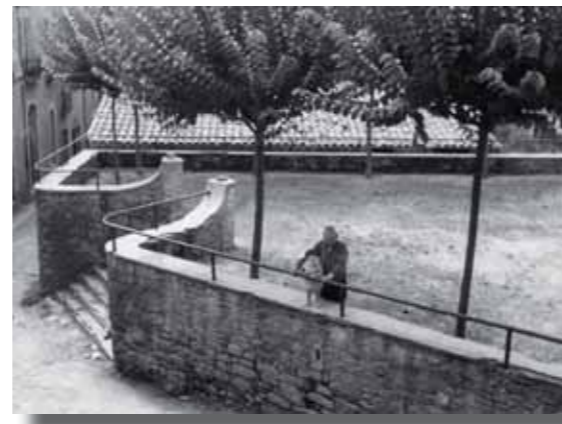
El terreno als anys 50

- Futbol: 01/05/2011 F.C. OLOST - CE EL BRULL a les 17h. 15/05/2011 F.C. OLOST - OAR VIC a les 17h15'.