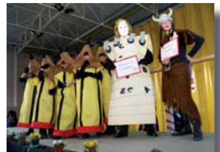
Entrega de premis carnaval 2011