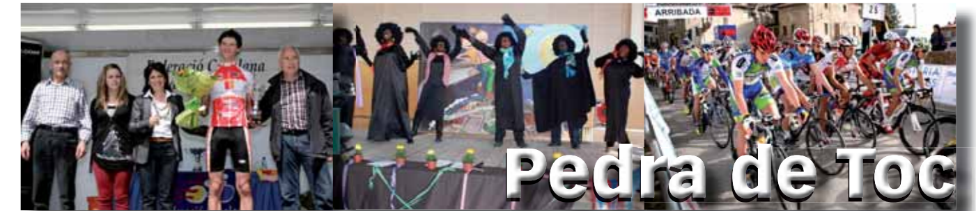
2a època | núm. 31 | abril 2011 | El butlletí municipal d'Olost i Santa Creu