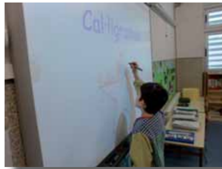
Utilització de la pissarra digital en una aula de l'escola. Març de 2011

Teniu alguna novetat pel curs 2011-2012? Les instruccions del Departament pel proper curs encara no han sortit, però si es presenta alguna convocatòria de Projectes d'innovació interessant, segur que ens hi apuntem...Els nostres objectius aniran en la línia de consolidar els projectes d'aula actuals, la socialització de llibres a CM i CS, la web de l'escola i, sobretot, avançar en l'ús de pissarres digitals i de noves tecnologies.