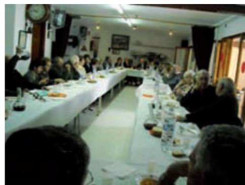
Calçotada Casal 2011

Veus el casal dels avis útil de cara al futur? Crec que sí. Ha de poder mantenir les activitats actuals i fer-ne de noves. És molt important també que hi hagi entrades de gent nova. També crec que és important que el casal segueixi tenint les seves portes obertes perquè tota la gent del poble el pugui fer servir quan així ho necessitin.