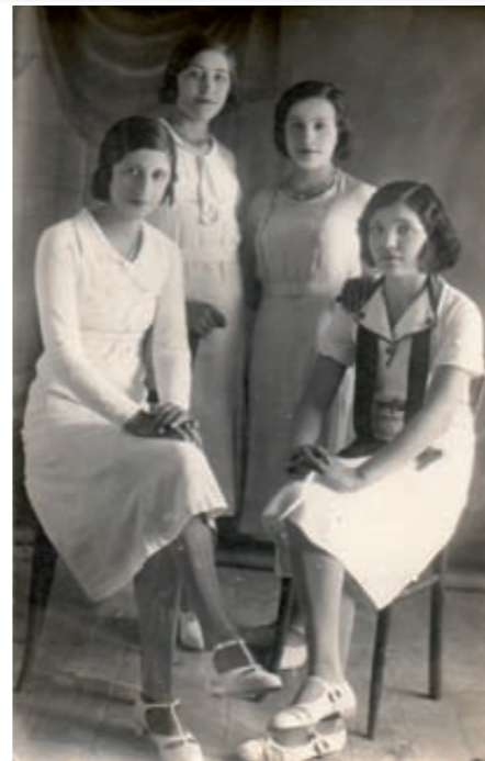
Foto d'estudi - anys 30