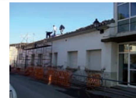
Imatge de l'escola en plena reforma-Febrer 2011

Les obres d'arranjament de l'escola vella que l'ajuntament va iniciar a finals del 2010 i principis del 2011 han consistit en reformar la teulada, arranjant i pintant la façana i posar a punt les diverses sales de la planta baixa de l'edifici per tal d'adaptar aquest espai a les funcions d'un nou equipament municipal. La finalitat d'aquestes obres, segons l'ajuntament, ha estat la de conservar l'edifici que es trobava bastant deteriorat i per altra banda, posar-lo a punt perquè es puguin desenvolupar les activitats pròpies d'un centre cívic.