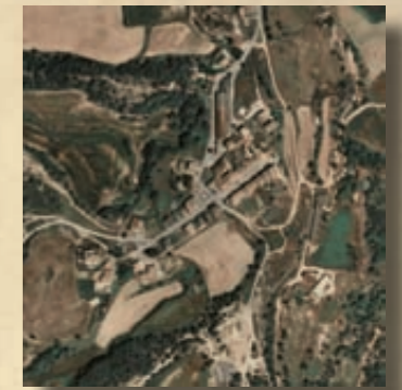
Fotografia aèria de santa creu de jutglar

Des d'aquí només podem animar a tots aquest veïns i veïnes perquè segueixin fent constar la presència de pudors davant el Consorci, que les registra i les transmet al consell comarcal. Gràcies a tots i a totes!