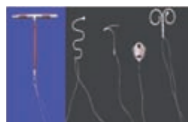
Dispositius in utero (DIU)