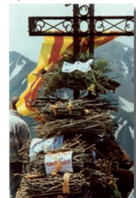
Les feixes cobreixen la creu del cim

La Flama del Canigó és el foc amb què s'encenen bona part de les fogueres de la nit de sant Joan d'arreu del país. La flama és durant tot l'any a la cuina del Museu de la Casa Pairal o Castellet de Perpinyà. Cada any, el 22 de juny, el foc surt del Castellet per encendre una foguera que es fa al cim de la muntanya del Canigó i, des d'allà, l'endemà es reparteix per tots els pobles de Catalunya que hi volen participar mitjançant una llarga cadena de relleus, que van distribuïnt el foc amb tots els mitjans possibles: a peu, amb bicicleta, amb cotxe i, fins i tot, a cavall. La flama arribarà també al Lluçanès. Una representació d'igualada recollirà la flama: anirà des del Coll d'Ares fins a Igualada, passant pel Lluçanès. La caravana entrarà al Lluçanès per Sant Quirze de Besora i anirà deixant la flama als pobles que es troben al recorregut: la cruïlla del Bar de Sant Agustí (12:15 h), Perafita (12:30 h), Prats de Lluçanès (13:15 h) i Sant Feliu Sasserra (14:10 h). Sortirà per Avinyó i cap a Igualada.