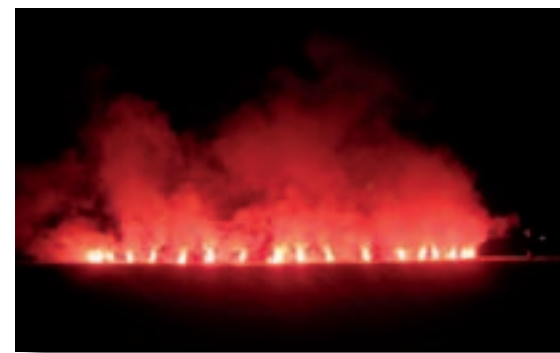
Nit de Sant Joan