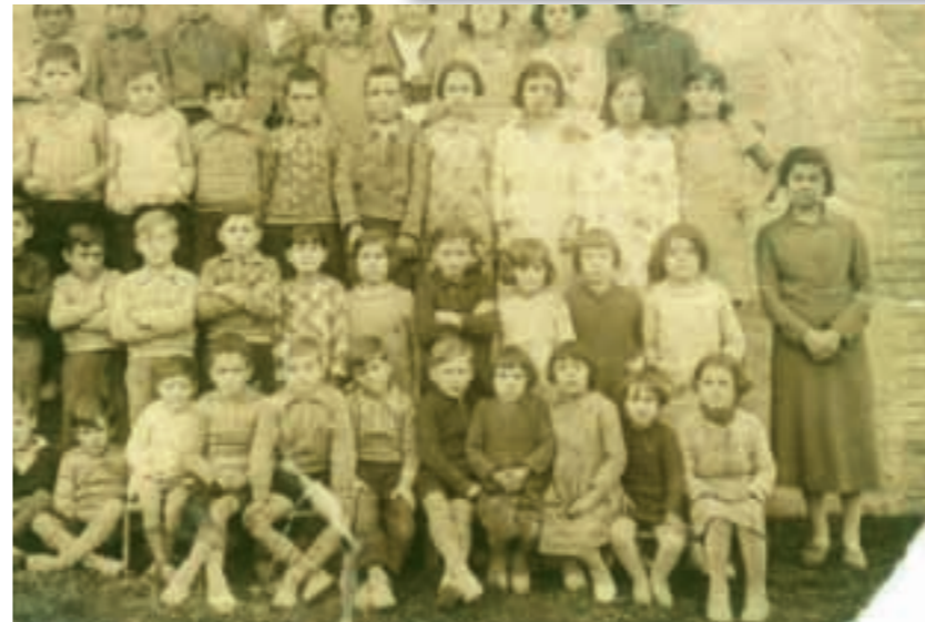
Escola Santa Creu els anys 30