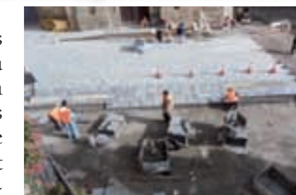
Obres a la Plaça Major. 1 de desembre de 2010.

Melcior, Gaspar i Baltasar, els reis que arriben del llunyà orient la nit del 5 de gener, per portar un present a tots aquells nens i nenes que s'han portat bé i una mica de carbó als que no s'hi han portat tant, podran fer la seva majestuosa arribada a la part central de la nostra i nova Plaça major d'Olost. Per aquest motiu volen fer una arribada una mica més espantosa... Tingueu els ulls molt oberts! I els adults, no perdeu la paciència que, de ben segur, també us portaran alguna coseta.