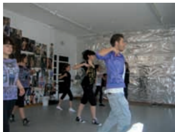
Curs de funky al local de joves 2010

D'altra banda, des del Punt Inquiet d'Olost s'està treballant per créixer i poder donar un espai de cohesió social i comunicació al jovent del poble. De moment el jovent té dos locals de trobada, però creiem que el servei hauria de millorar, i és per això que es vol aprofitar un espai per obrir-ho a més jovent del poble. També es vol treballar amb les entitats del municipi per donar-los suport. puntinquiet@llucanes.cat 93 888 00 50.