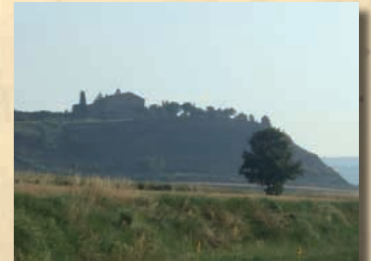
Sant Adjutori 2010

L'ermita de Sant Adjutori, situada al capdamunt del serrat del mateix nom, al sud-oest del nucli urbà, és una edificació d'estil modern, que comprèn una capella adossada a la casa dels ermitans. La construcció s'inicià l'any 1713, quan l'olostenc Josep Carbonell obtingué del bisbe de Vic el permís d'edificació en un terreny cedit per Joan Cabanes, del mas Cabanes d'Oristà. L'ermita fou erigida juntament amb la casa annexa vers l'any 1714. El desembre de 1717, després de treballs dificultosos, es va fer a la capella un ofici solemne celebrat per diversos sacerdots, entre ells el rector de Sallent. Després de més d'un segle i a causa del mal estat de l'ermita, es reconstruí la capella i es col·locà un nou altar. Això fou el 1880. Durant la Guerra Civil espanyola (1936-1939), Sant Adjutori fou l'església que quedà més afectada; calgué rehabilitar-la per poder-hi retornar el culte. L'any 1984 s'intentà una campanya de restauració completa de la capella i de la casa, que no es portà a terme fins el 1989. El 17 de desembre de 1989 s'inaugurà el temple restaurat, amb la presència de Josep Maria Guix. Aprofitant la campanya, s'erigí la capella en santuari.