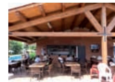
Terrassa del bar de la piscina. Estiu 2010

A les piscines, aquest estiu, ens hem trobat amb la finalització del projecte de remodelació del bar i dels vestidors. Ara es disposa de 4 vestidors, uns lavabos públics accessibles des del bar mateix i des del camp de futbol, un sistema de climatització als vestidors per a l'hivern, una nova cobertura a la terrassa i l'ampliació de la cuina. Tot plegat ha costat més de 200.000 €.