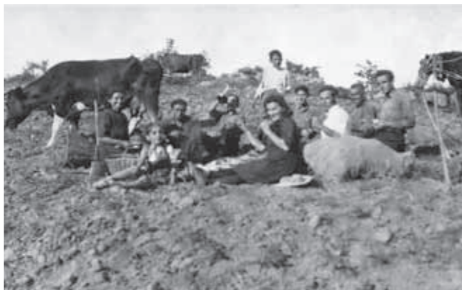
Berenar a camps de Santa Creu -anys 40-

s'encarregaven de fer una altra feina igual o més important: portar-los el menjar, fent fins a cinc visites al llarg del dia per a l'esmorzar, una mica de beguda a mig matí, el dinar amb una bona cassola de tall, un berenar a mitja tarda i, finalment, el que s'anomenava "l'aixecada de l'ase", ja al capvespre, quan els portaven alguna cosa per picar (una mica de llonganissa o algunes ametlles). La feina era feixuga, però es recorda que sempre hi havia un bon ambient.