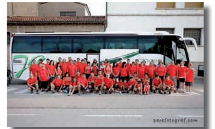
La ruta del carrilet

Per cert, us informem que el proper diumenge 23 de maig es disputarà el "VI Trofeu Cursa del Lluçanès", la nostra cursa ciclista de carretera, inclosa en la Copa Espanya de Juvenils i molt reconeguda a la comarca.