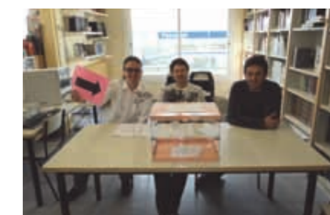
Inici Jornada electoral 25A

El dia 25 d'abril, Olost i Santa Creu, amb 220 municipis de la resta del país, va participar d'aquesta festa democràtica, la del dret a decidir. Va fer un paper molt digne, que aguanta la comparació amb municipis veïns o de dimensions semblants: 45% de participació (44% a Olost i 49% a Santa Creu de Jutglar), 94% vots a favor del sí, 2% del no i 3% de vots blanc. La plataforma us dona les gràcies!