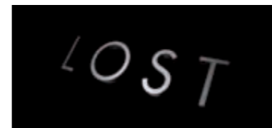
Logotip de la sèrie

Poques vegades trobes una trama que t'obligui a aïllar-te de tot. Això és el que aconseguirà la sèrie de J.J. Abrahams Lost . En aquests moments estem gaudint de la sisena i última temporada (o no...), i encara ens estem preguntant si realment pot tenir un final digne de les expectatives creades. Els capítols –són els més baixats de la xarxa– estan farcits de tota mena d'intrigues, emocions, aventures i misteris, en un paratge tan bell com feréstec d'una illa que ens remet a uns orígens incerts i mitològics. És una sèrie que marca un abans i un després en tot el que s'emet actualment. És tal l'àurea d'incògnites i misteris que planteja que es fa inútil intentar explicar a algú de què va sense descobrir-li massa "secrets"... S'ha de veure! I per això la pregunta més freqüent entre els seguidors és: I tu per on passes?