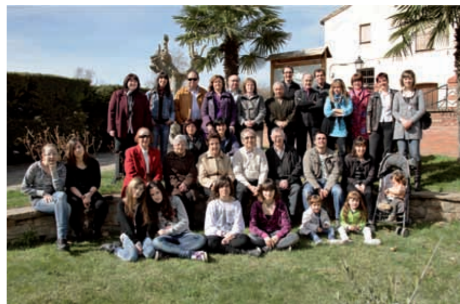
Col·laboradors del Pedra de Toc