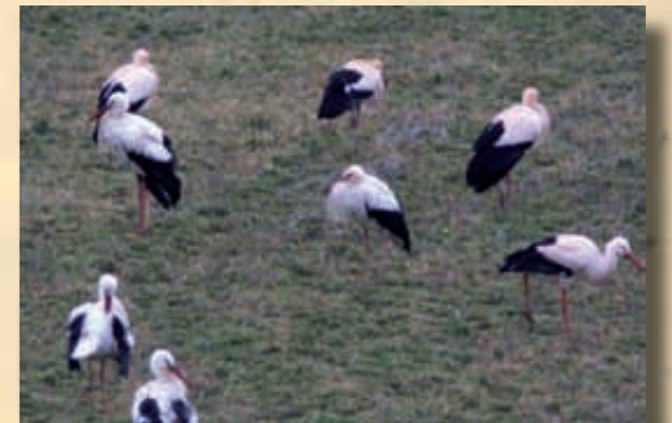
Cigonyes al seu pas per Olost. 2010

La primavera i la tardor són èpoques de migració de molts ocells, com la cigonya blanca ( Ciconia ciconia ), que sovint es veuen els mesos de febrer i març quan viatgen cap al nord i centre d'Europa o a finals d'estiu quan es dirigeixen al sud. Olost és sovint una parada en aquest llarg viatge. Enguany s'han vist un parell de vegades: la més nombrosa, la nit del 19 al 20 de febrer, en què es va veure un estol de 83 cigonyes. Algunes d'aquestes cigonyes duïen unes anelles de colors que se'ls col·loca quan són polls per ser llegides a distància i que permeten identificar-les sense tornar-les a capturar. Aquestes marques donen informació sobre el lloc i l'any de naixement. El portal web Observació d'ocells amb marques especials permet fer un seguiment dels avistaments fets. De l'estol que va fer parada a Olost es van llegir fins a 23 anelles, i així vam saber que 10 van ser anellades a Alemanya, 3 a Suïssa i 8 a França –una d'elles, concretament a París-. Una d'aquestes cigonyes que es va veure a Olost va néixer a Menchhoffen (França) l'any 2006 i va ser vista l'agost d'aquell mateix any a Vic quan anava al sud. Finalment, hem pogut saber que la següent parada d'aquest grup va ser Palau-Saverdera (Alt Empordà), el 21 de febrer.