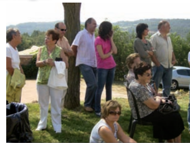
festa major '09

Com veieu el present i el futur de la comissió? Som 5 persones, tots treballem i fer gaire més, per part nostra, és impossible. Ens aniria molt bé que entrés gent jove, per poder anar pensant en futurs relleus.