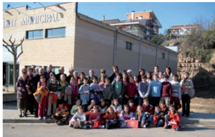
"El conte de l'avi" i "L'escola a l'horta"

Aquest estiu farà tres temporades que es va posar en marxa el nou servei municipal d'atenció a la dependència i envelliment actiu que ha desembocat en el Programa Activa't!. Aquesta és un programa d'oferta intensa i variable, tant al matí com a la tarda, que ha anat creixent gràcies a la resposta de bona part dels grans del poble. Avui, el servei disposa d'un espai de dia que funciona cada dimarts i dijous de 10 a 12 que compta amb 6 participants, i d'un seguit de projectes i activitats de dinamització de tarda com, per exemple, grups d'activitat física a Olost i Santa Creu, tallers de memòria a Olost i a Santa Creu, Cinema al casal, Grup de tertúlia sobre cuina antiga i tradicional, cicles de conferències sobre l'envelliment, projectes intergeneracionals (com amb una quinzena de voluntaris i en col·laboració amb l'escola pública, el taller "Vivències" sobre la recuperació de la memòria històrica, cursos de això, amb una relació cada vegada més estreta i del Casal d'avis d'Olost i la seva junta. Us convidem. Gràcies per endavant!