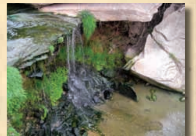
Salt d'aigua del Gorg de la Donzella, riera d'Olost, 2009

El Gorg de la Donzella està situat al sud del nucli urbà d'Olost, a pocs metres de la depuradora del poble, en un punt força engorjat de la riera d'Olost. Es tracta d'un gorg de dimensions mitjanes i de forma ovalada. Queda tancat en tres quarts de part del volt per un cingle rocós que assoleix alçades d'uns 4 metres. L'aigua arriba al gorg fent un petit salt d'un metre i arriba a una petita plataforma rocosa, on rep les aigües tractades per la depuradora, just abans de saltar els quatre metres del cingle rocós. Just sota el salt d'aigua, la roca forma una petita balma plena de vegetació. A l'interior del gorg hi ha grans blocs de pedra despresos, alguns dels quals, de color negrós, es troben just sota el saltant d'aigua. Sobre el gorg, en un punt on la riera és estreta i passa entre roques, hi ha dos blocs rectangulars de pedra treballats, que formaven unes passeres que permetien creuar la riera a peu.