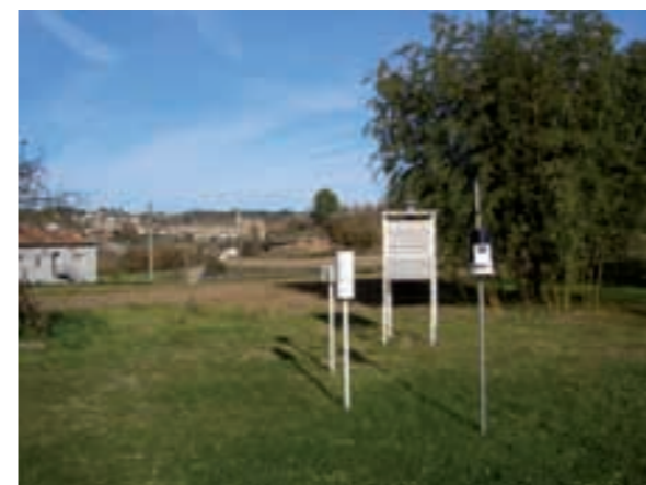
Nova Estació Meteorològica d'en Pere Bruc. Desembre 2009

Què ens pots dir del temps que ha fet aquest 2009? Cal ser prudents perquè no tenim les dades de desembre, però crec que serà un any més plujós del normal (de 50 a 100 litres per sobre la mitja) i un any calent: una temperatura mitjana de tots els anys de 12,5° C i aquest 2009 superarà els 13°C. Mig grau és molt en temperatures mitjanes.