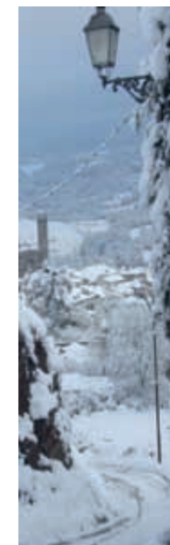
Nevada Olost 2009

Hi havia un temps en què els nens naixien a casa. Hi havia una època en què els reis eren generosos, així com els seus ajudants. Hi havia uns anys, llunyans, en què els ajudants repartien felicitat i somriures entre tots els nens i nenes, i els que ja no ho eren tant. Es deia que venien de molt lluny, que es guiaven amb les estrelles... I es deia que eren els Reis Mags d'Orient i els patges reials. Es diu –i això es diu avui– que un dels patges s'acosta cap a Olost i Santa Creu. Si així ho creieu, podeu anar, el 27 de desembre, a les 5 de la tarda a Santa Creu, o a les 6 a Olost, i potser el veureu.