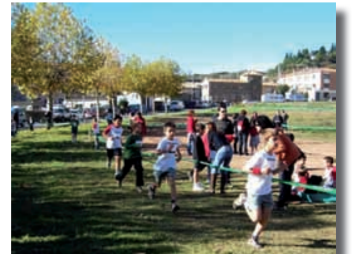
1º cursa de Cros escolar, novembre 2009

Novembre. La comissió del Correllengua ret homenatge a Manuel de Pedrolo juntament amb les biblioteques del Lluçanès. Té lloc la 1a Cursa escolar de cros; hi participen 145 nens i nenes.