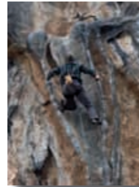
Via Viatge a Venus a Montgrony (1)

L'escalada és una activitat esportiva que consisteix bàsicament en avançar de manera vertical per parets naturals o artificials, amb l'ajuda del propi cos. En l'escalada hi ha diferents modalitats: via llarga, esportiva, bloc, psicobloc i artificial. Fa gairebé set anys que vaig provar aquest esport per primera vegada, i la veritat és que durant tots aquests anys d'escalada he après moltes coses: normes, valors, esforç, constància, respecte... I també m'ha fet descobrir molts racons, com l'illa de Còrsega. Per això recomano que ho proveu, per les sensacions, experiències, viatges i altres que ens dona l'escalada. Animo sobretot a grans i petits, perquè l'escalada no coneix edats! A part d'escalar muntanyes, hi ha llocs molt segurs on practicar l'escalada. Cal Ferrer, a Olost, és un d'ells.