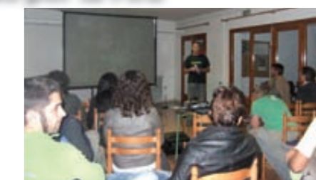
Sena passada de diapositives de muntanya

Un any més, el Club excursionista Via Fora ens va oferir una sessió de cinema de muntanya amb la projecció de diapositives de Nanga Parbat. Mentre hi hagi llum , basada en l'ascensió al Nanga Parba (8126 m.) el 1997 per alpinistes osonencs. També es va projectar Solstici d'estiu. Obertura de la via , una filmació realitzada mentre s'obria una nova via d'escalada a la cara nord del Pollegó Inferior del Pedraforca.