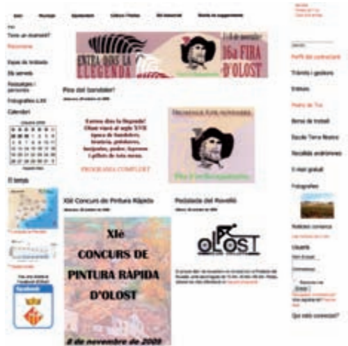
La web d'Olost

El funcionament d'aquesta web passa per acostar l'Ajuntament al ciutadà, donant l'oportunitat de realitzar tràmits des de casa, l'oficina o qualsevol altre lloc. Es poden sol·licitar llicències municipals, demanar cita amb l'alcalde o els regidors d'àrea, o consultar el perfil del contractant, on hi podem trobar els contractes d'obres, servei i subministrament que hi ha pendents o en curs de licitació i adjudicació a Olost. També s'ha de poder consultar informació de l'Ajuntament i del municipi. Cal tenir en compte que una de les coses que genera més consultes a la web és la publicació de notícies i actes previstos. Per aquest motiu, també es disposa, des del mes de maig, dels articles del Pedra de toc en format digital.