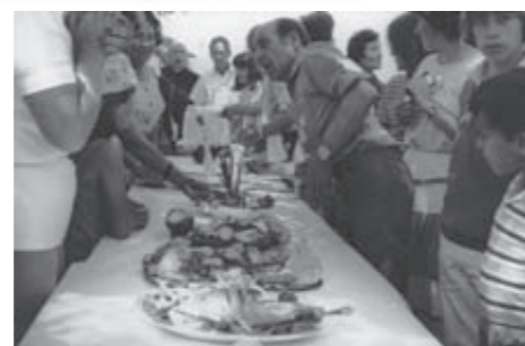
En pistola als anys 80