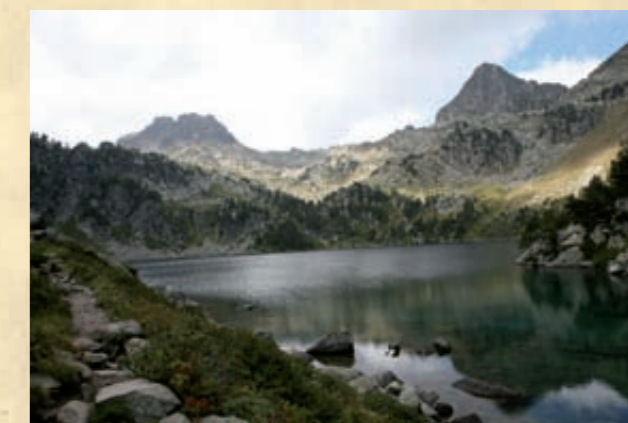
Estany de Gerber, setembre 2009

Un dia un propietari d'un canut —que sempre el duia a la butxaca de la camisa—, va tenir molta set i es va ajupir a beure aigua d'una font, amb tanta mala sort que li va caure el canut. Ràpidament es va buidar i van sortir els minairons amb moltes ganes de treballar. El pobre home es va posar tan nerviós pensant que el matarien que els va dir el primer que li va passar pel cap. Així que els va manar que agafessin cadascun una pedra i l'amunteguessin a les muntanyes de les valls. És per això que avui dia, quan fem excursions, trobem tarteres: gràcies a la feina que van fer aquests petits éssers.