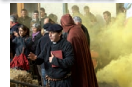
Fira d'en Rocaguinarda 2009

El diumenge 8 de novembre, els veïns i veïnes d'Olost i tota aquella gent que ens va venir a veure vam poder participar de la 16a Fira d'artesans. Va ser la primera fira centrada en el personatge d'en Perot Rocaguinarda. Al voltant d'unes 100 persones voluntàries van fer possible una nova fira, plena d'acció, teatre i emocions. Gràcies a tots per la vostra feina. En Rocaguinarda tornarà! No en tingueu cap dubte!