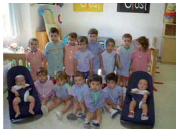
Llar d'Infants Estel-2009

Actualment l'equip professional de la Llar d'infants Estel, consolidat des de fa anys, està integrat per una mestra i una educadora.