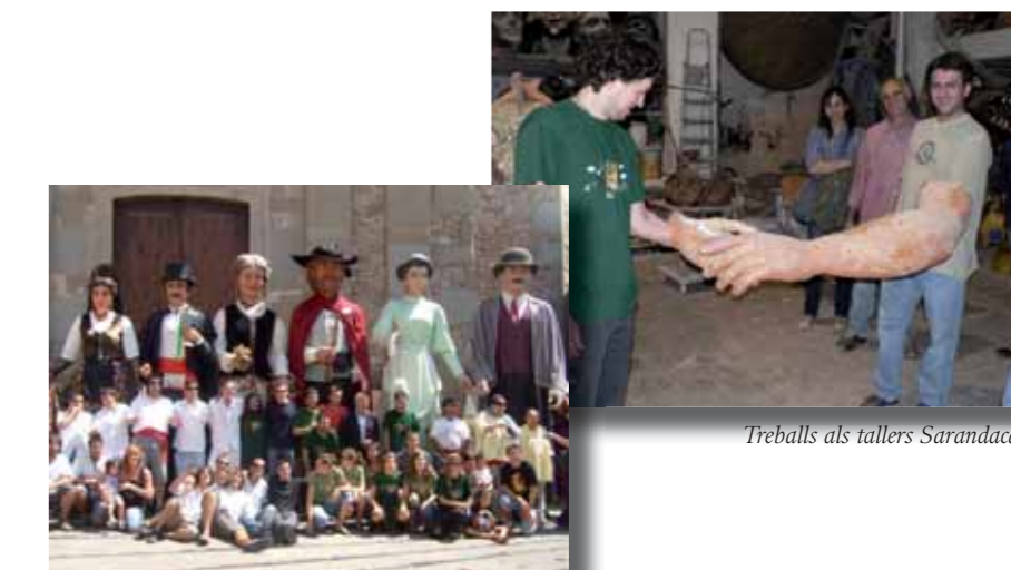
Inauguració gegants agost 2009

El passat 15 d'agost, el dia de la Festa Major, vam tenir el privilegi de poder estrenar gegants. Els nous Perot i Mercè van sortir a la plaça per primera vegada, després que el 27 de juliol els tallers Sarandaca, de Granollers, acabessin l'encàrrec que els havia fet el municipi d'Olost. Aquests nous gegants són exactament iguals que els vells, amb una sola excepció, però molt important per a qualsevol geganter: pesen la meitat que els anteriors.