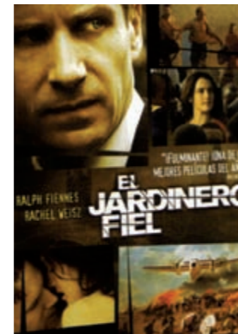
Portada del DVD de la pel·lícula.

La pel·lícula El jardinero fiel m'ha semblat extraordinària. Investiga la rapacitat de les grans corporacions, l'abús que sofreixen els pobles africans, la corrupció governamental i, per sota de tot això, hi ha una irresistible història d'amor. Per a mi, el cor de la història és la relació entre Justin i Tessa. En altres paraules: la història d'un home que manca d'opinions polítiques, que descobreix qui era realment la dona que estimava després que ella mori i que decideix lliurar la seva vida a continuar el que feia, apropant-se encara més a ella en la mort que en la vida.