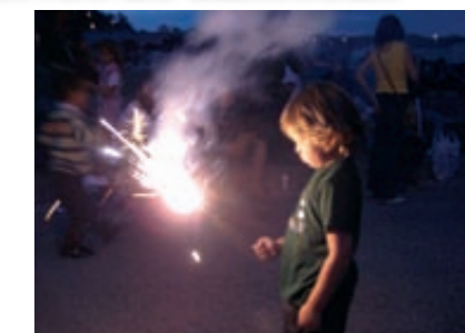
Revetlla de Sant Joan 2009

La nit del 23 de juny, un any més, Olost va donar la benvinguda a l'estiu. I ho va fer amb una revetlla al passeig Montserrat, amb petards, una gran foguera i un sopar. Hi van passar més de 175 persones. Hi havia botifarres i coca, i un espectacle de música i foc a càrrec dels Cremats, organitzadors principals de la festa. Tot plegat va acabar amb el ball de La Portàtil FM.