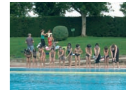
Curset de natació 2009

El dilluns 6 de juliol va començar una nova edició dels cursos de natació a les Piscines municipals. Els cursos comencen a les 15.30 de la tarda i es distribueixen els nens en funció del nivell i de l'edat. El preu de la inscripció és de 40 euros. Els inscrits són uns 35 i han estat distribuïts en 4 grups, l'últim dels quals, finalitza la classe a les 7 de la tarda.