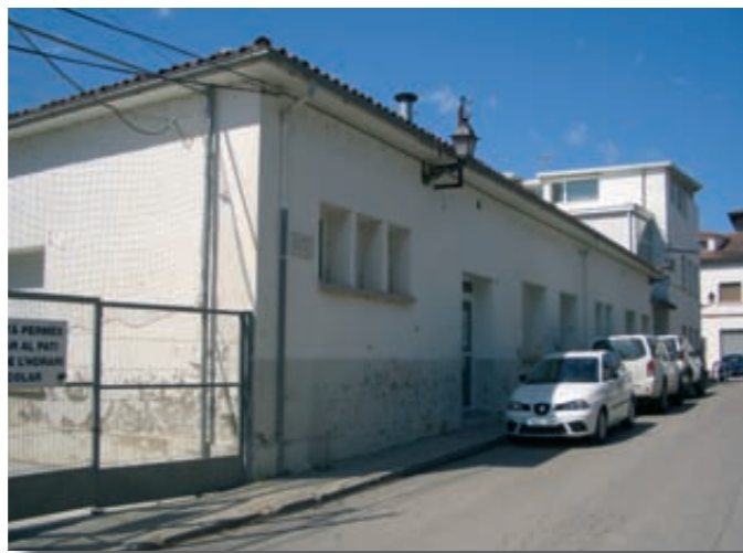
Edifici de l'escola vella.

L'edifici de l'escola vella és un dels llocs més polivalents que hi ha a tot el poble. S'hi poden realitzar moltes activitats a causa de la seva amplitud, és relativament nou, de fàcil accés i al centre del poble. L'activitat que sempre ha estat present és la de crear un centre de dia per a la gent gran, però ja té una altra ubicació assignada. Per tant es podrien repartir algunes de les aules que hi ha, per a les diferents entitats del poble, ja que ara per ara n'hi ha moltes que no tenen on reunir-se o desfer els seus utensilis, i més si el casal dels joves es destina a la creació del centre de dia. Per altra banda, crec que també seria adient poder-hi fer una zona d'esbarjo apte per a totes les edats on poder passar tots aquells caps de setmana i estones mortes, és a dir, un espai lucratiu, que jo personalment ubicaria a l'antic pati de l'escola vella. Així doncs, seria molt adient que l'escola vella es destinés a serveis o a usos socials i culturals pel poble.