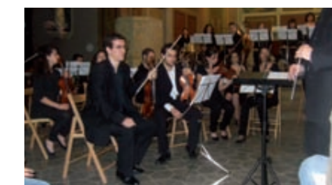
Orquestra simfònica Diaula Maig 2009

El 17 de maig passat va tenir lloc un esdeveniment cultural no gaire freqüent al nostre poble, un concert de música clàssica al fantàstic escenari de l'església de Santa Maria. Una orquestra simfònica amb una quarantena de músics joves i de gran nivell que van interpretar des de peces contemporànies fins a clàssics del cinema com la música de West Side Story. Un gran concert amb la presència d'un músic local inclòs al capdavant de la percussió!