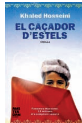
Portada del llibre

M'agrada molt llegir i últimament m'interessen les novel·les d'autors estrangers. Trobo que és una manera de viatjar per llocs exòtics, d'apropar-se a la cultura d'aquests països i comprendre millor la seva història, ja que la lectura et fa posar a la pell dels personatges. El caçador d'estels és una novel·la que té per escenari Afganistan. Ens parla de l'amistat entre Amir, fill d'un home ric, i Hassan, fill d'un hazara de classe inferior; de la traïció entre ells dos després de la competició més important d'estels de Kabul; i del preu de la lleialtat (Amir emigra als Estats Units i torna a l'Afganistan, inmers en la dictadura dels talibans, per guanyar el perdó del seu amic). Espero haver despertat la vostra curiositat. De ben segur que no us decebrà.