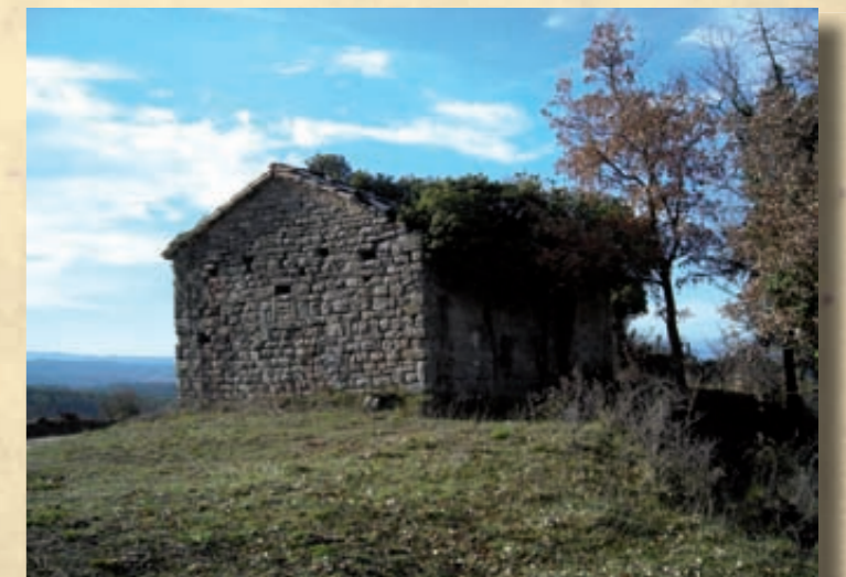
Església romànica de Sant Andreu de Tresserres

Sant Andreu de Tresserres és una petita església situada a uns 20 metres al nord-est de la masia de Tresserres, en un petit serrat elevat des d'on es pot veure gran part del terme municipal. S'hi pot anar des d'Olost agafant el camí de Pela fins al Xalet i seguint en direcció a la Casanova de Pela pel camí de la dreta durant uns 2 km. Sant Andreu és una església de planta rectangular, amb l'absis carrat i la teulada de doble vessant amb aigües a les façanes laterals. Fou construïda amb murs de maçoneria de pedra amb algunes parts de carreus carejats disposats en filades regulars i cantonades diferenciades de carreus de majors dimensions. La façana principal, orientada a l'oest, presenta un portal d'arc de mig punt adovellat i brancals de pedra. Coronava la façana un campanar d'espadanya, avui desaparegut. El temple actual no correspon a l'edifici documentat el segle XIII, si bé alguns elements d'aquesta primera construcció es troben encara integrats en l'edifici actual.