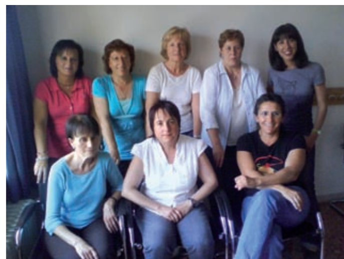
Grup de suport cuidadores informals

Cal buscar coses que ocupin la gent que estan en situació de dependència. Considerem important que es pugui donar servei de menjador i que es pugui obrir matí i tarda, i amb una oferta flexible, de manera que les persones puguin anar-hi d'una forma estable o en estades temporals. Caldria buscar solucions per al transport de les persones, ja que n'hi ha moltes que no hi podran arribar per culpa de les barreres arquitectòniques. Caldria fer-hi activitats de gimnàstica i altres activitats pròpies d'un centre de dia. I tot això, amb un servei mèdic o un ambulatori que pugui cobrir les necessitats i les urgències que sorgeixin durant les activitats. Tot el que sigui obrir nous serveis ja ens està bé.