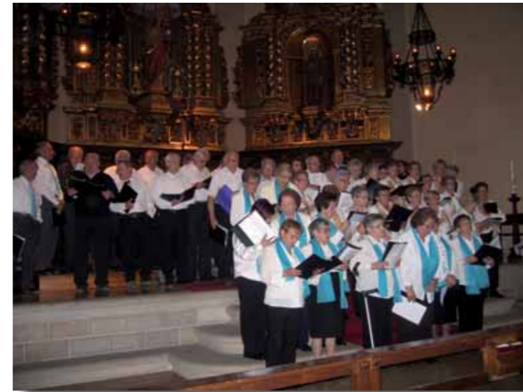
Centelles, abril 2009

Si tinguéssim ara i aquí el geni de la làmpada d'Aladí, què li demanaríeu com a presidenta de la coral Noves Veus? Principalment, la continuïtat de la coral: l'arribada de "noves veus", gent nova que en garantitzés el futur.