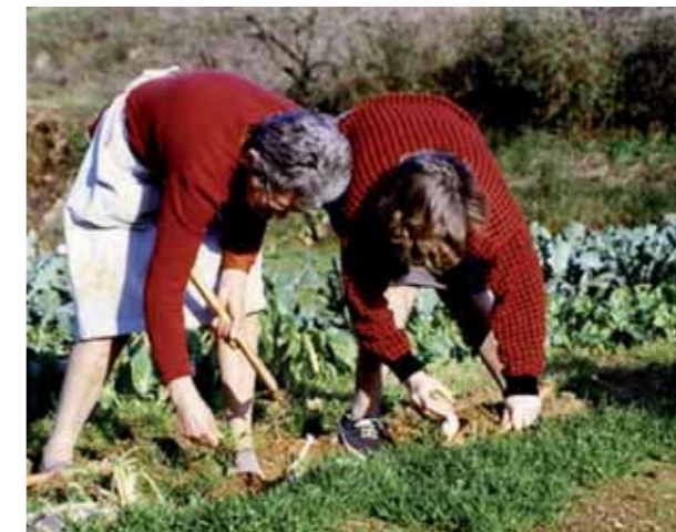
La dona pagesa

El departament de Treball de la Generalitat posa en marxa una iniciativa pionera per ajudar les dones de l'àmbit rural. Atorgarà ajudes, enguany de 2.000 €, a les dones d'aquest col·lectiu per facilitar el seu accés a la titularitat compartida de les explotacions agràries. Això els ha de permetre un reconeixement de la seva feina, dels seus drets laborals i la protecció de la seguretat social.