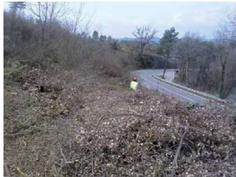
Obres a la carretera

Els canvis per millorar sempre són bons. Aquesta nova carretera unirà dues comarques, Osona i el Berguedà, i portarà a la població d'Olost i Santa Creu un moviment de persones d'aquestes comarques veïnes, a més a més de noves vies d'accés per trobar feina. Estarem en un punt mig entre les dues comarques, i també al centre del Lluçanès, i això pot atreure noves indústries a Olost. Pel mateix motiu, i com que les carreteres seran més bones, pot ser que tinguem més turisme i que augmenti la població.