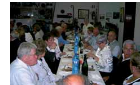
Festa del 22 aniversari del casal dels avis

El mateix dia 26 d'abril es va inaugurar la zona esportiva i educativa. La inauguració va començar amb un esmorzar per tothom. Després es va fer l'acte al vestíbul del poliesportiu, ja que la pluja queia generosament. El tall de cinta el va presidir l'honorable Conseller de Governació de la Generalitat de Catalunya, el senyor Jordi Ausàs, que després va assistir al dinar d'aniversari del Casal dels Avis.