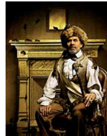
L'inspector, Nikolai Gógol