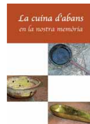
Portada llibre de cuina

El dia 26 d'abril, dins els actes de celebració dels 22 anys del Casal dels Avis d'Olost, es va presentar el llibre La cuina d'abans en la nostra memòria . Un llibre treballat i somiat per un grup d'onze olostenques, que amb dos anys de feina constant l'han fet possible. En trobareu exemplars a l'Ajuntament, al Casal, a Ca La Lola i a la Llibreria Griera. Us el recomanem!