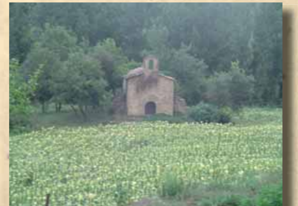
Sta. Magdalena de la Tria

Fou documentada per primera vegada el 1241 en el testament de Beatriu d'Olost. Sempre serví com a capella dependent del mas la Tria. Aquesta situació es mantingué fins que fou abandonada i restà sense culte. Actualment és una petita joia malmesa del romànic de les nostres contrades.