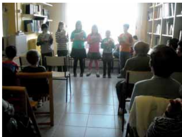
Sant Jordi 2009 a la Biblioteca

Les seves conclusions han de servir a partir d'ara per dur a terme projectes eficaços que comptin amb la implicació i la participació de la ciutadania, tant en el disseny com en la realització, apropant la política municipal als ciutadans. De les propostes recollides, n'han sorgit possibles projectes de futur, com per exemple: a) accés i ús dels espais i equipaments públics, b) fer projectes relacionats amb la sostenibilitat, l'aigua i els recursos naturals, c) entendre l'educació al municipi com a eina de civisme, d) fer polítiques de suport a la gent gran. No és una llista tancada, sinó tot el contrari: tot just ara es comença a decidir per on es pot actuar.